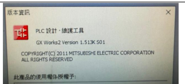
GX Works2 Version 1.513K S01