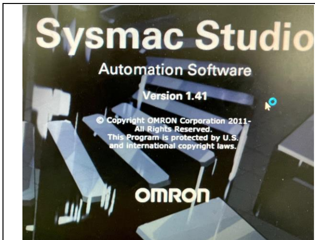
OMRON Sysmac Studio V1.41