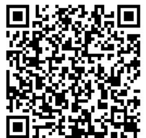
▲報名表 QR code