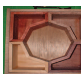
賴老師創意比賽獲獎小檔案

【本報訊】本校為配合校國民民主法治教育，宣導校園民主，希望學生一切生活及學習，均能透過正常的民主管道，發表有建設性的意見，讓學生有機會體驗及參與學校各項行政措施之意見表達，協助校務推展的工作，特別辦理班級學生代表暢言餐會。